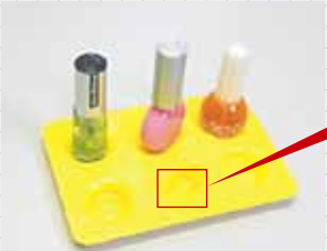
1 ワークを押し当てるだけで専用固定台に。

ディスプレイ用設置台から、量産用ワーク 作業効率アップ 固定治具まで。幅広いニーズにお応えします。