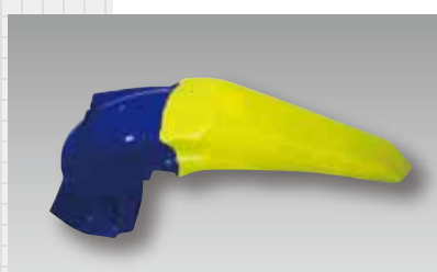
2 PP・ABS樹脂製品のカバーが好評。