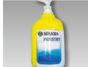
1 ラベル貼付け作業の位置決めに。