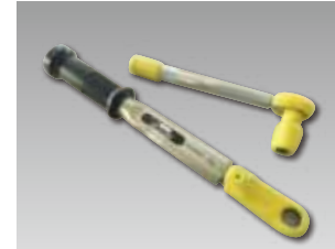
2 工具の持ち手や製品との接触防止カバー。