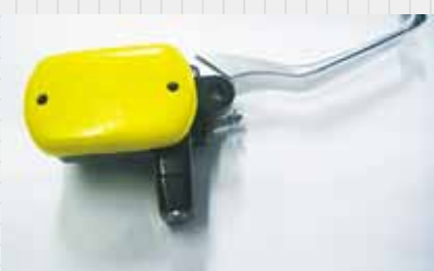
1 金属製品の外観部カバーに。